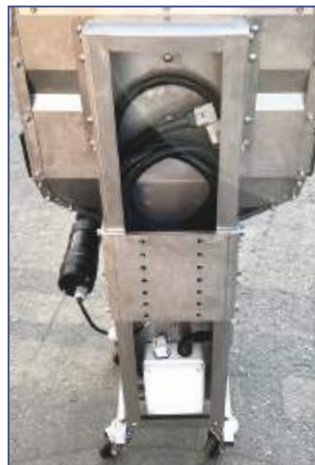
Supporto posteriore (attacco standard)