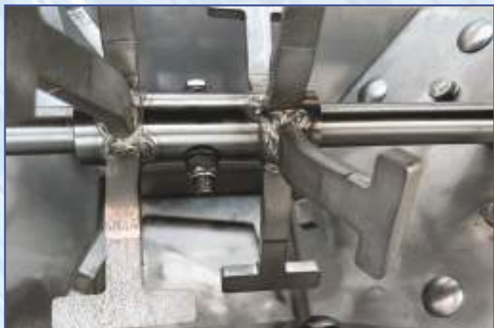
Albero mescolatore interno tramoggia a funzionamento elettrico