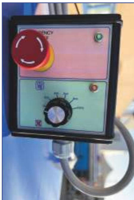
Pulsantiera di comando