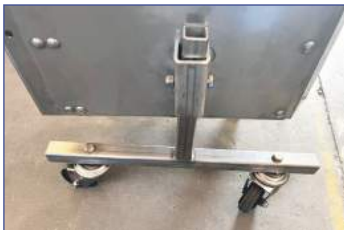
Piedi di parcheggio