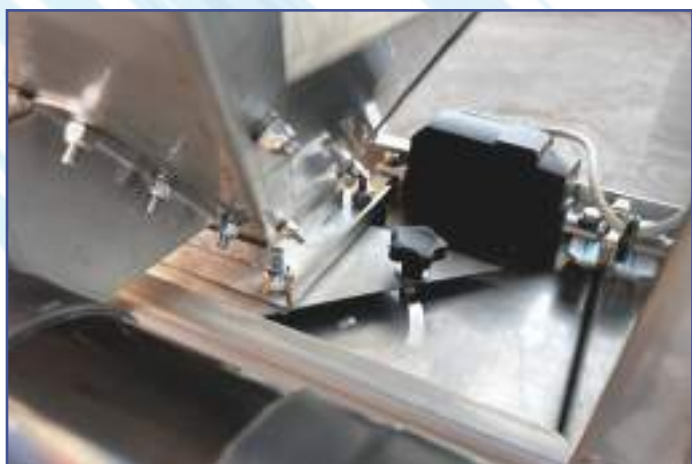
Attuatore elettrico per on/off spargimento