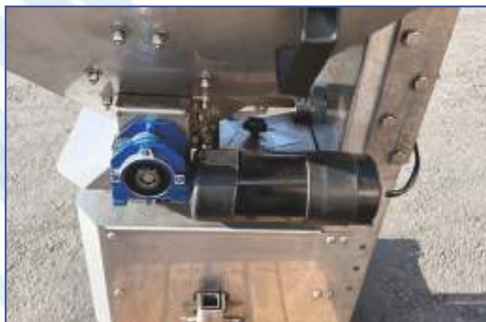
Albero mescolatore esterno tramoggia a funzionamento elettrico