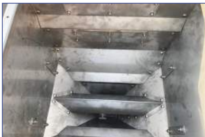
Coppo interno tramoggia