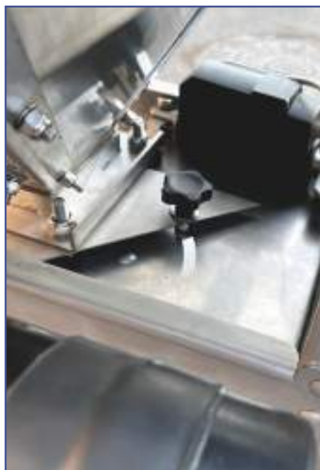
Ghigliottina per regolazione quantità di spargimento