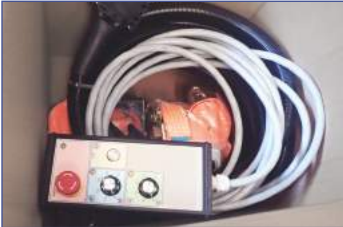
Pulsantiera di comando