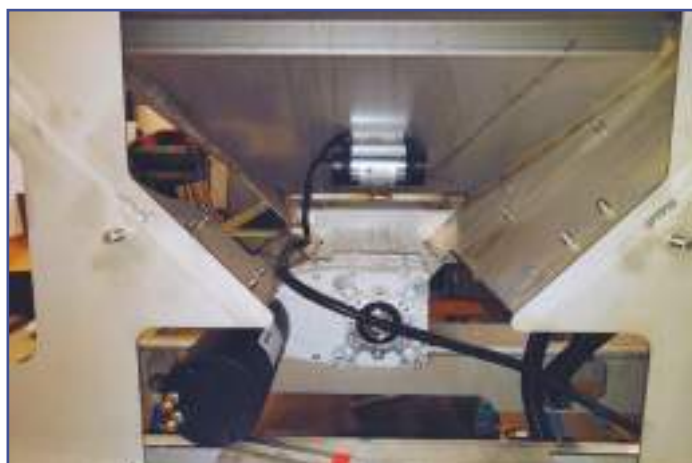
Motore elettrico 12 V 24 V con riduttore per rotazione coclea