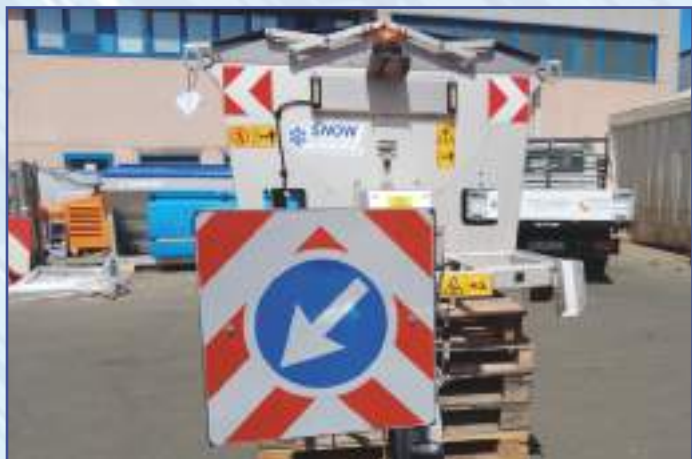
Cartello con freccia (50 cm x 50 cm)