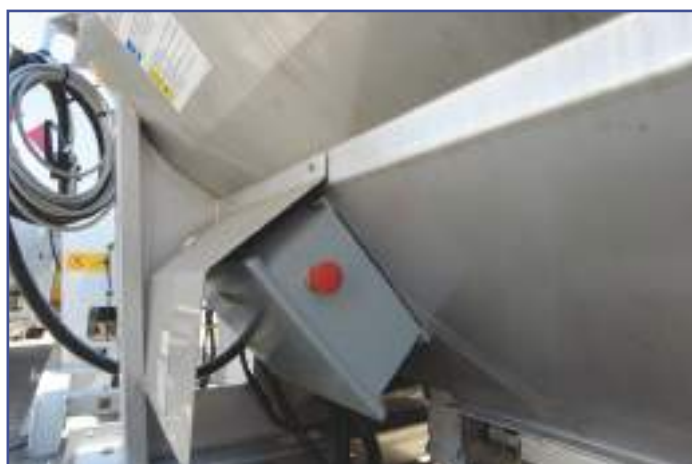
Impianto elettrico 12 V 24 V IP68