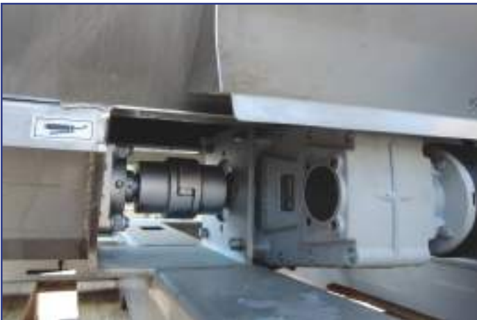
Riduttore per trascinamento coclea di spargimento con giunto elastico