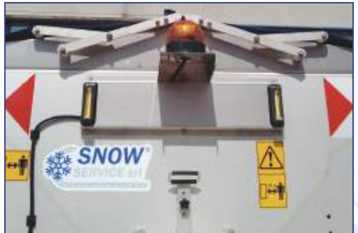
Porta targa ripetitrice con luce strobo e lampeggiante