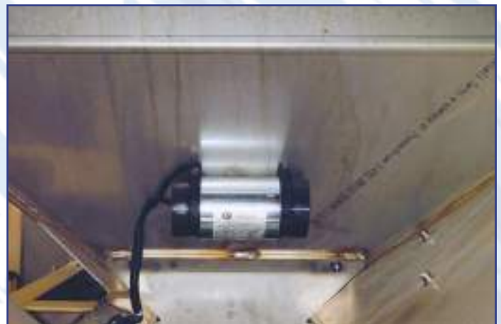
Vibratore elettrico 12 V 24 V per agevolare il distacco del sale dalle pareti