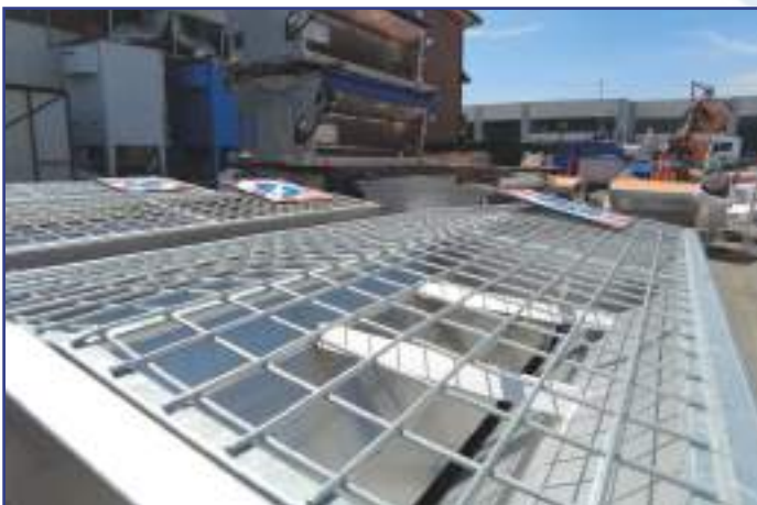
Vaglio in rete in acciaio zincato a caldo