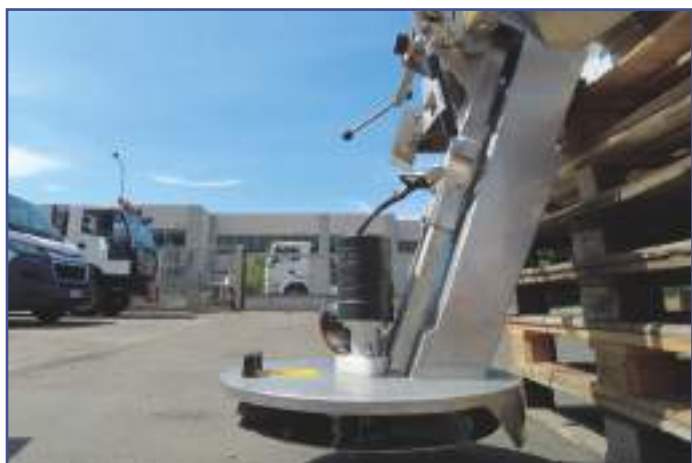
Motore elettrico 12 V 24 V per rotazione disco di spargimento