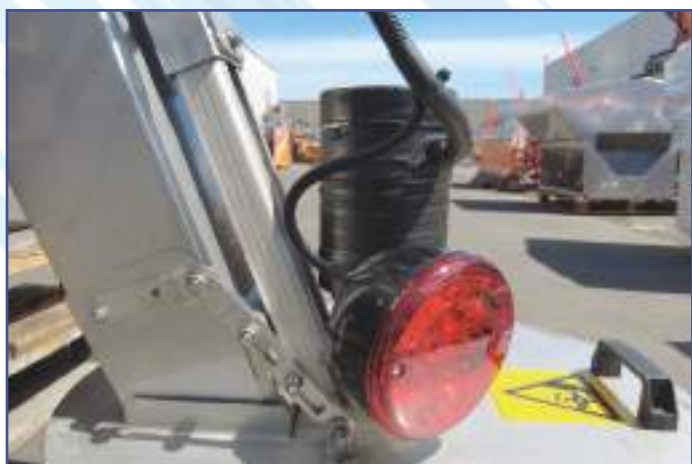
Faro di lavoro rosso