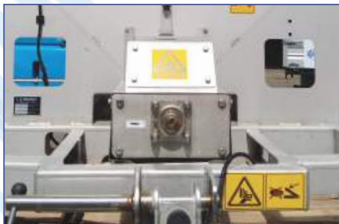
Cuscinetti in acciaio inox